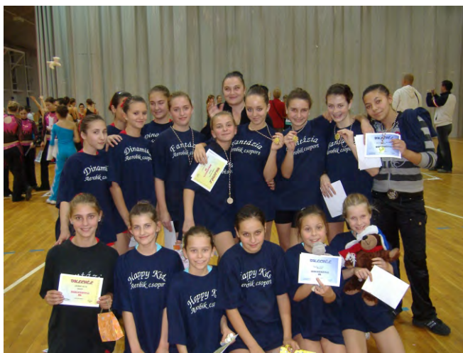
A dobozi aerobikosok ismét szép eredménnyel tértek haza az Országos Amatőr Dance és Step Aerobik Bajnokságról.