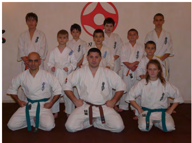
Samuray Kyokushin Karate Egyesület karatékái új edzőteremben készülnek a közelgő versenyekre.