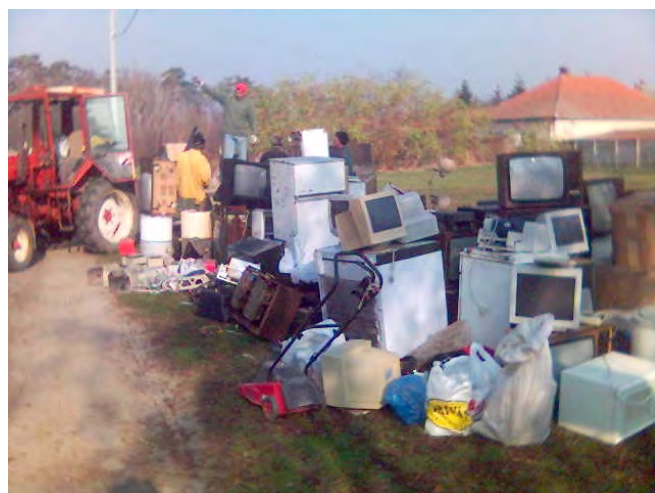
A lakosságnál felhalmozódott veszélyes hulladékot ingyenesen szállította el az Önkormányzat.