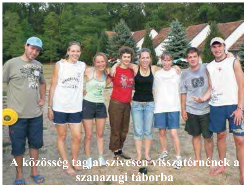
A közösség tagjai szívesen visszatérnének a szanazugi táborba

Harminckét országból mintegy százötvenen érkeztek a Békés Megyei Gyermek és Ifjúsági Táborba az International Fellowship of Evangelical Students (IFES) jóvoltából.