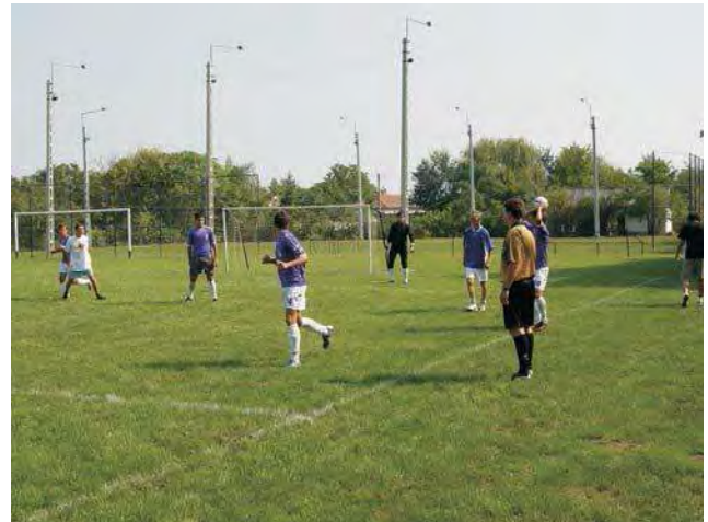
...és a játék

Idén is megrendezésre került az Augusztus 20. felnőtt, kispályás labdarúgó kupa.