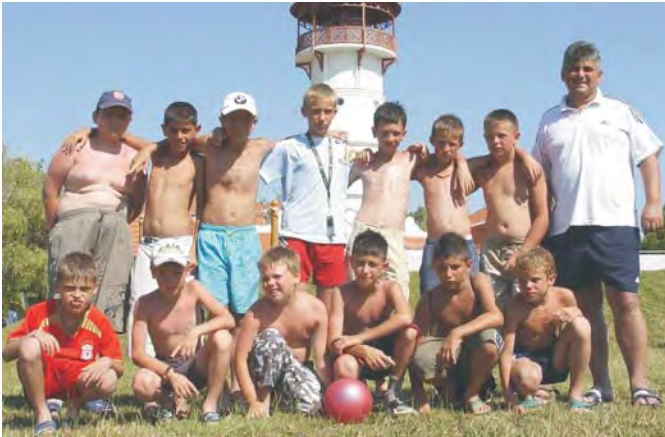
A gyopárosi strand nagy élményt jelentett a csapat számára

Idén is megrendezésre került az Zsigmond Károly testnevelő iskoláskorú gyerekek számára a focitábor. A tapasztalatokról számolt be: "A nagy meleg ellenére egy héten keresztül ker-