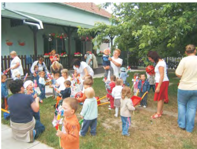
A gyerekek nagy örömmel fogadták a gondozó néniktől kapott ajándékot

Hagyományhoz híven idén is megrendezésre került bölcsődénkben a gyermeknap, ahol szülők-nagyszülők is részt vehettünk, és együtt ünnepeleltünk gyermekeinkkel.