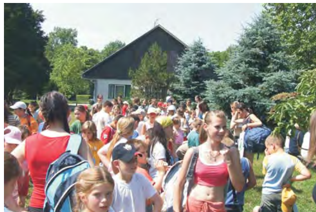
Kissé fáradtan és óriási izgalommal érkezett meg a csapat a gyereknapi rendezvény helyszínére.