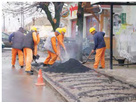
A HÓDÚT Kft. leaszfaltozta a buszmegállót