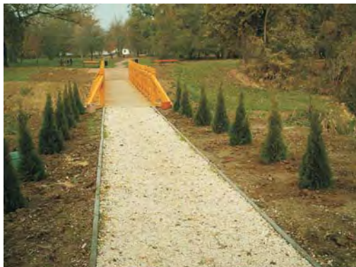
Szilágyi Mihály (Sallai utca) felajánlásából tujafa csemetéket ültettek