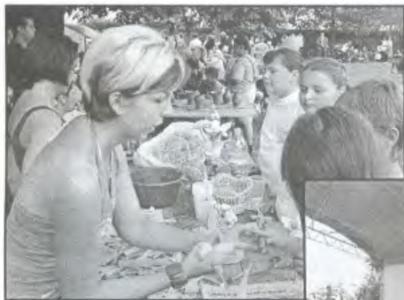
Helyi kézműveseink bemutatkozása.