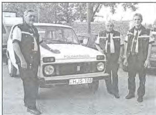
Május 1-jén új egyenruhában teljesítettek szolgálatot a polgárőrök.

Trafipaxos sebességmérés a település belterületén a következő napokon lesz: