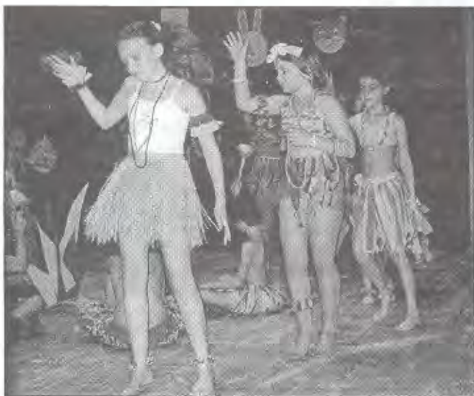
Felső farsang kicsit másként...

Iskolánkban február 27-én a hetedik osztályosok szervezésében farsangi mulatságot rendeztünk.