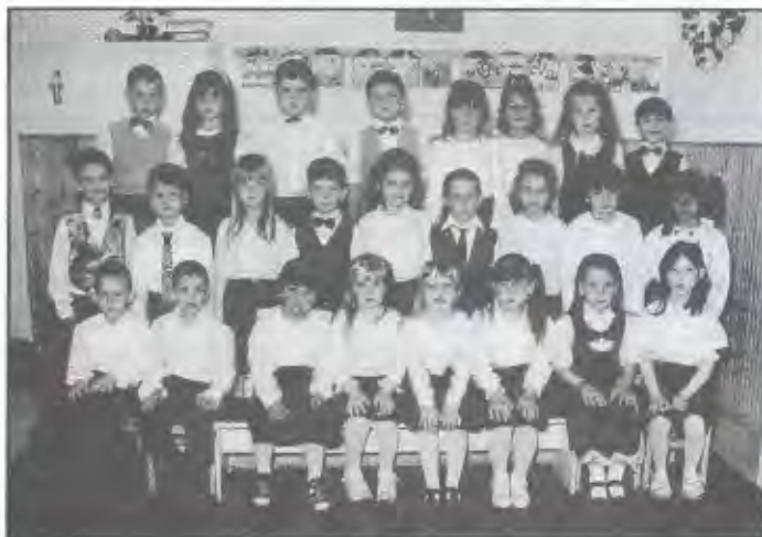
Az I-es számú óvoda ballagó ovisai.

Útravalóként sok jó jegyet és minden jót kívánunk nektek kedves gyerekek!