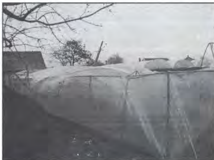
A képen Szabó Mihály megrongálódott fóliája látható.