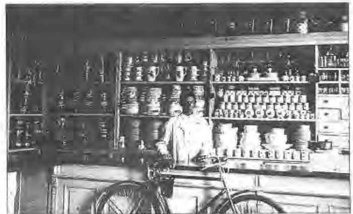
Az 1940-es évek Hangya Szövetkezté - a bolt és a "kocsma", ami kisebb átalakítással jelenleg is így működik