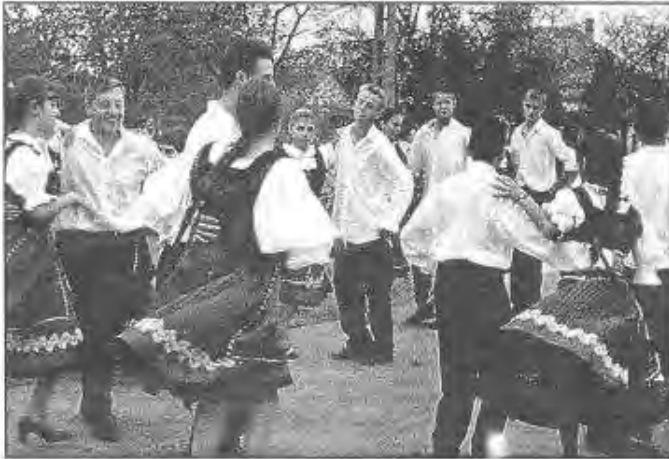
Pörgetem, forgatom, libbennek a szoknyák...

Ehet majd és ihat apraja és nagyja, egészen addig, míg a gazda hagyja!"