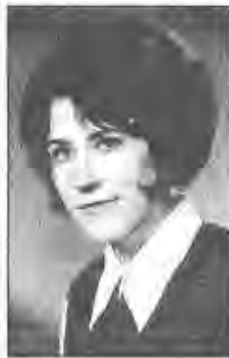
Babits: A második ének

"Megmondom a ütkét, édesem a dalnak: Önmagát hallgatja, aki dalra hallgat. Mindenik embernek a lelkében dal van És a saját lelkét hallja minden dalban. És akinek szép a lelkében az ének, Az hallja a mások énekét is szépen."