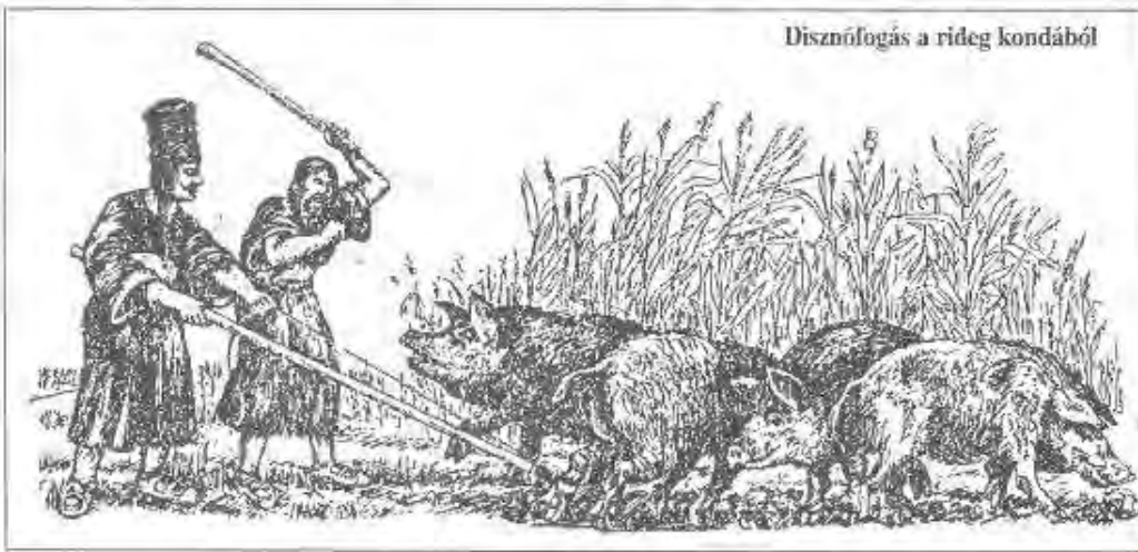
Disznófogás a rideg kondából