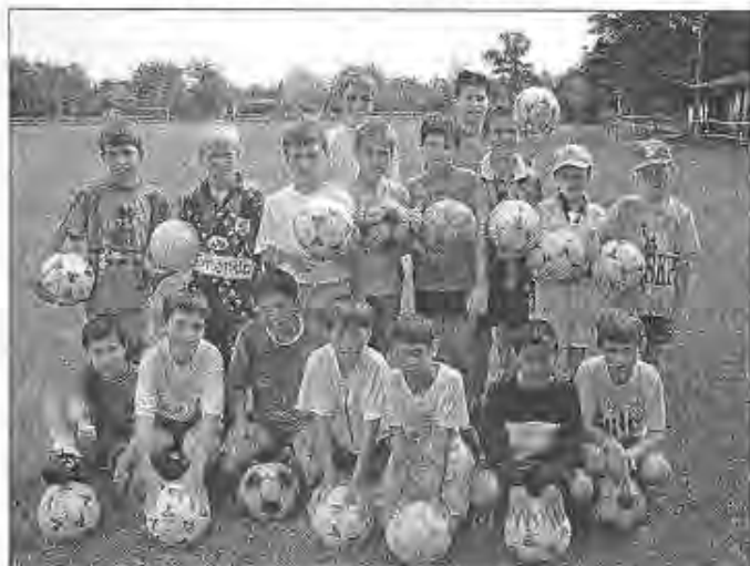
Az első turnus focistái az új labdákkal