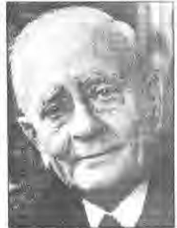
Féja Géza (1900-1978)

Gyulán egy barátom bejelentette vacsora után, hogy egy dobozi legény énekelni szeretne nekem. Be is jött a fiú még „át nem csiszolt” és el nem torzított paraszttarccal, zöld színű, fekete süjtással ékesített mundérban, a régi nemesi öltözet s a vármegyei hajdúdísz e fura öszvérhajításában. Mindenáron Rakóczi kesergőjével és hasonló endrődyzmusokkal akart megörvendeztetni, de én mereven visszautasítottam s arra kértem, hogy azt dalolja, amit otthon,