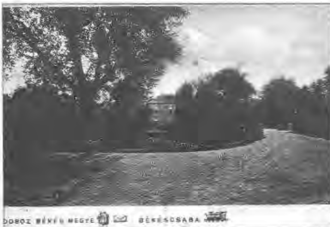
DOBOZ BÉKÉS MEGYE BÉKÉSCSABA