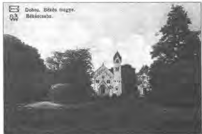
Doboz, Békés megye. Békéscsaba.