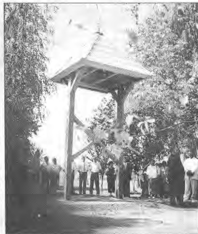
Harangláb-szentelés és -avatás, valamint lélekharang avatás