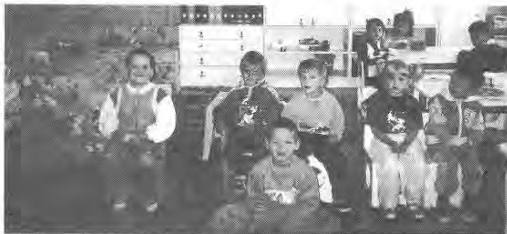
A boldog ovások

A két öreg épület, ha nem is lett új, de mind kívülről, mind belülről megújult és használha-