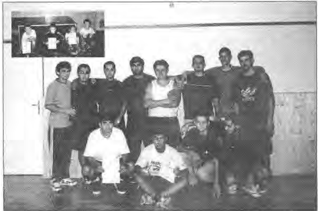
A nagy képen a felnőtt résztvevők egy csoportja, a kis képen pedig a díjazott gyerekek