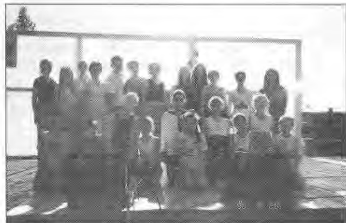
A divatbemutató résztvevői