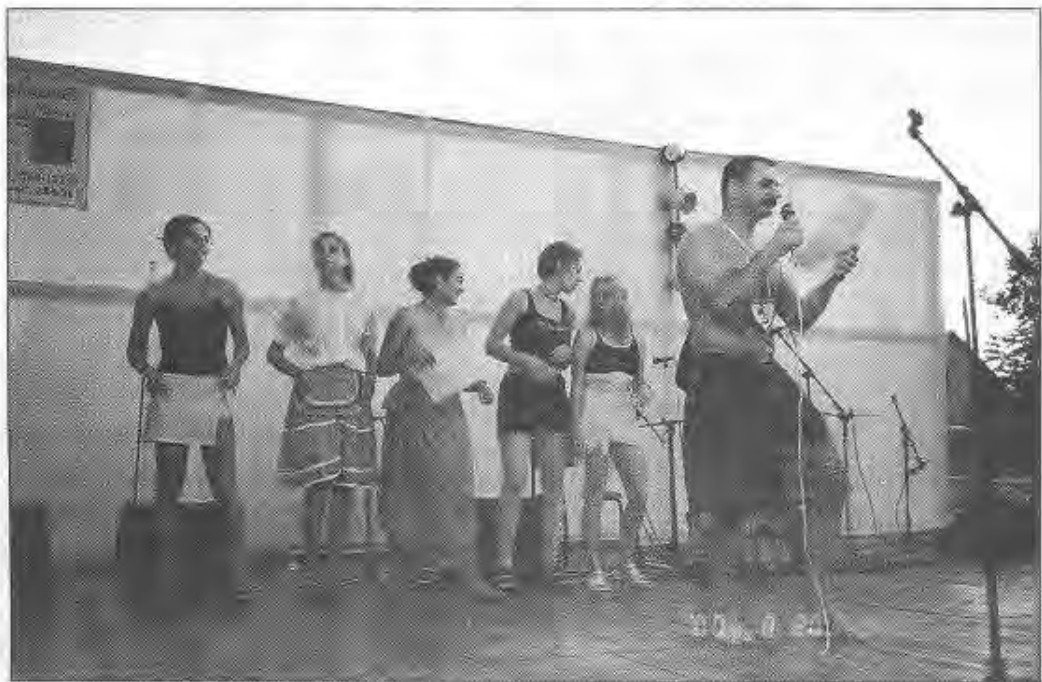
Doboz szépe választás

A baráti társaságokat, családokat a délután folyamán mókás vetélkedőre invitálták, ahol a titkosírástól a dinnyeévésig, az énekléstől a „tehénfejésig” mindent ki lehetett próbálni. De volt még divatbemutató, aerobik-show is a kíváncsi szemeknek.