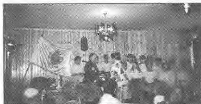
A "Doboz Nagyközségért" emlékérem átadása