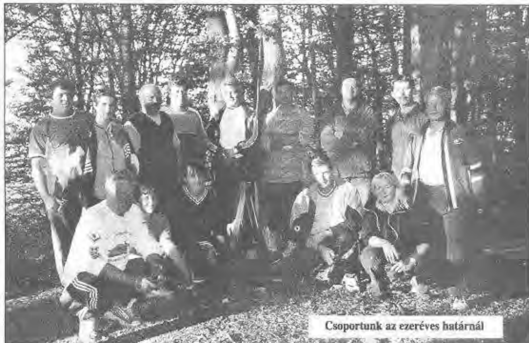
Csoportunk az ezeréves határnál

sével kezdődött a község adakozásából néhány éve felépített katolikus templomban. Az ezer évet felidéző megemlékezést a világháborús emlékmű közös megkoszorúzása követte, majd egy pompás díszebéd. A hazaindulás előtti napon a csoport nagy kirándulást tett a természetben. Testvérközségünknek 28.000 hektár gyönyörű fenyőerdeje van, ami ideális erre a célra. Megnéztek egy hegyvidéki esztenát (birkahodályt) és megkóstolták a helyi juhsajt specialitást, az ordát. Hazafelé a hosszú úton a sok szép emlék felidézése megrövidítette az amúgy hosszú és fáradságos utat. Végezetül