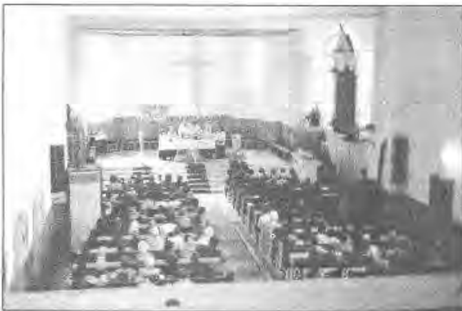
Millenniumi szentmise Ozsdolán

Múlt havi számunk folytatásaként a doboziak programját szeretnénk vázlatosan bemutatni. A határt átlépve a kisbusz az Arad - Déva - Sebes - Fogaras - Sepsiszentgyörgy - Ozsdola útvonalon haladt. A küldöttség szeptember 6 -án, szerda este érkezett a testvérközségbe, így aznapra már csak a háziakkal való rövid ismerkedés és a szállás elfoglalása maradt. Másnap délelőtt Kézdivásárhelynek, a történelmi Magyarország legkeletibb városának nevezetességeit tekintették meg, így a Kézműves Múzeumot, Gábor Áronnak, a hely szülöttének a szobrát, valamint a belváros szép régi épületeit. Ebéd után egy közeli kisváros, Csernáton érdekessége, a szabadtéri mezőgazdasági régiségek kiállítása következett, majd a Szent Anna-tóhoz látogattak el. Szeptember 8-án volt a hiva-