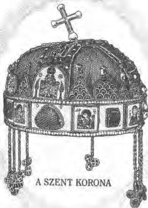
A SZENT KORONA

Millenniumi Kulturális- és Sportnapok – Doboz, 2000. augusztus 19-20. Részletes program a 2-3. oldalon.