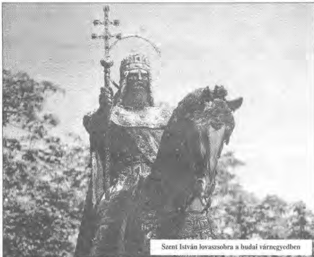
Szent István lovaszobra a budai várnegyedben

Az országos változások sok elégedetlenséget is szültek a nép körében. A régi vallás hívei nehezmenyésztek az idegen lovagok és egyházi emberek előtérbe kerülését, valamint sérelmezték az egyházi adó kivetését. A társadalom és gazdaság ilyen nagymértékű átalakítása a közrendű szabad magyarok szegényebbje-